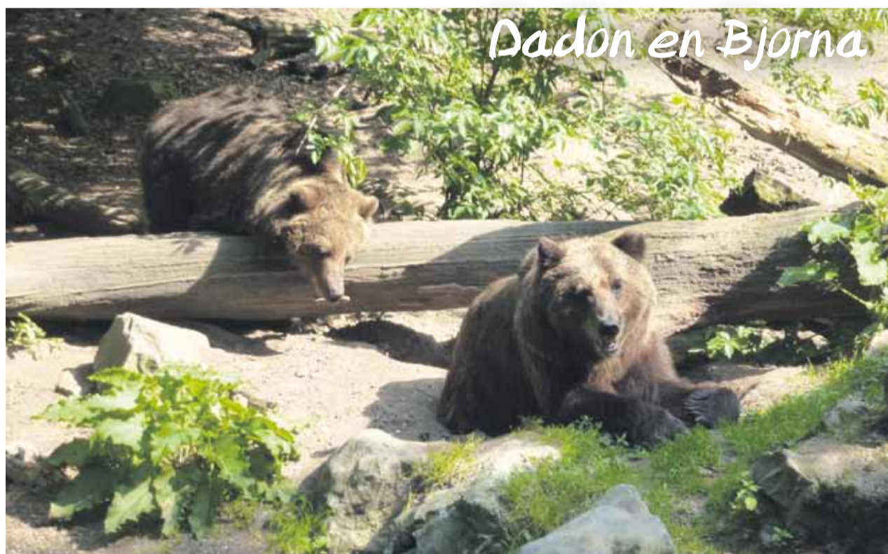
Dadon en Bjorna