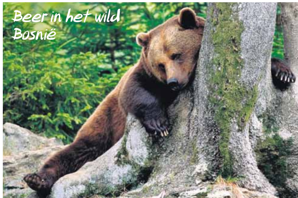
Beer in het wild Bosnië

Bears in Mind heeft contact opgenomen met een Europese bruine beren specialist in Kroatië en is zo terecht gekomen bij een kleine groep onderzoekers die al werkzaam waren op het gebied van beren, maar zich voornamelijk bezighielden met mens-beer conflicten. Het 'Centre for Environment' en de universiteit van Banja Luka kwamen