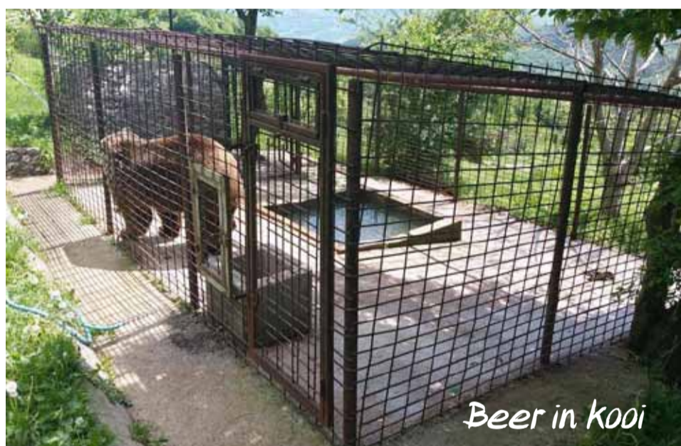
Beer in kooi

met een voorstel om in kaart te brengen hoeveel beren er nog in gevangenschap zitten in Bosnië, op welke locaties en onder welke omstandigheden. Deze inventarisatie is in april 2018 begonnen en in juni ontving Bears in Mind de eerste resultaten. In totaal zijn elf beren gevonden, in de meeste situaties 2 op iedere locatie, hoewel vaak wel van elkaar gescheiden. Velen vormen een attractie en een paar eigenaren geven aan een privé dierentuin te willen opzetten waar ook de beren een onderdeel van zijn. De leeftijd van de beren varieert tussen de 1,5 en 17 jaar en al zien de meeste beren er van een afstand gezond uit, onderzoek zou mogelijk heel wat gebreken aantonen. Slechte voeding, een leven lang op beton in krappe kooien, weinig tot geen zonlicht of bescherming tegen de elementen zullen zeker een effect hebben op de gezondheid van deze beren. En alle kooien zijn kaal, er is geen verrijking te zien zodat de beren hun natuurlijke gedrag niet kunnen uiten. Dit zal zeker leiden tot abnormaal gedrag, waaronder het stereotiep lopen.