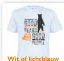
Wit of lichtblauw

Keuze uit 2 opdrukken: het logo van Bears in Mind en een origineel ontwerp van Lucien de Groot met de tekst: What's good for bears is good for people.