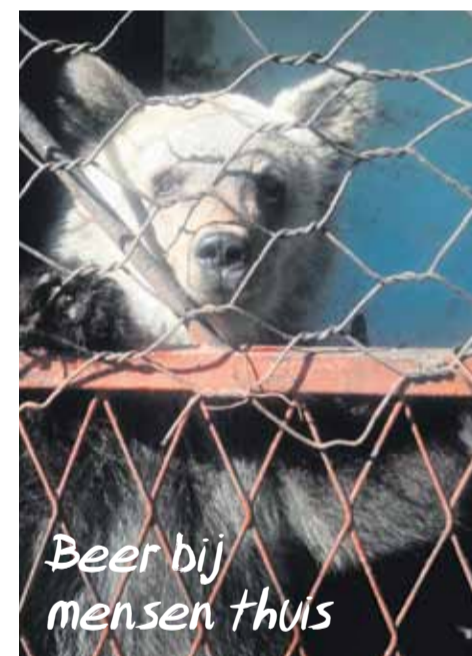
Beer bij mensen thuis

De beste oplossing voor de beren is inbeslagname en herplaatsing. Al lijkt Het Berenbos in Rhenen een goede optie, nog beter zou het natuurlijk zijn om een Berenbos in Bosnië te bouwen. De in beslag genomen beren kunnen hier voor het eerst vrij rond