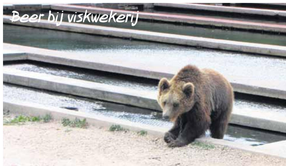
Beer bij viskwekerij

lopen, zich uitstrekken, vriendschappen opbouwen met andere beren en erg belangrijk, meer van hun natuurlijke gedrag uitoefenen zoals het rusten tijdens de wintermaanden. Tegelijkertijd kunnen bezoekers meer leren over beren en vormen de opgevangen beren ambassadeurs voor beren in het wild. Zo zien mensen in dat het beschermen van de natuur betekent dat een imposant, prachtig en belangrijk dier als de bruine beer ook in het wild voor blijft komen.