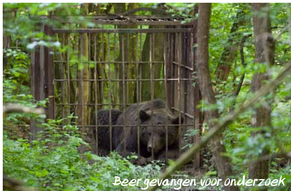
Beer gevangen voor onderzoek

dinsdag t/m vrijdag 09.30-17.00 - lunchpauze 13.00-14.00 zaterdag 09.30-16.00