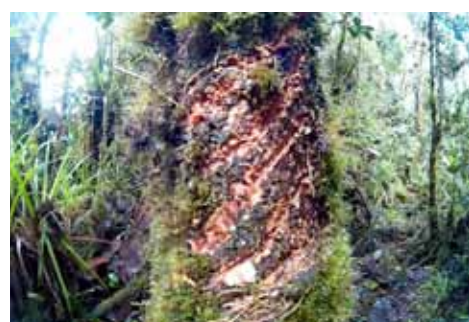
De komende drie jaar worden in twee onderzoeksgebieden in Ecuador gegevens verzameld. Met deze data kan een database van genetisch materiaal van de brilberen worden opgesteld.