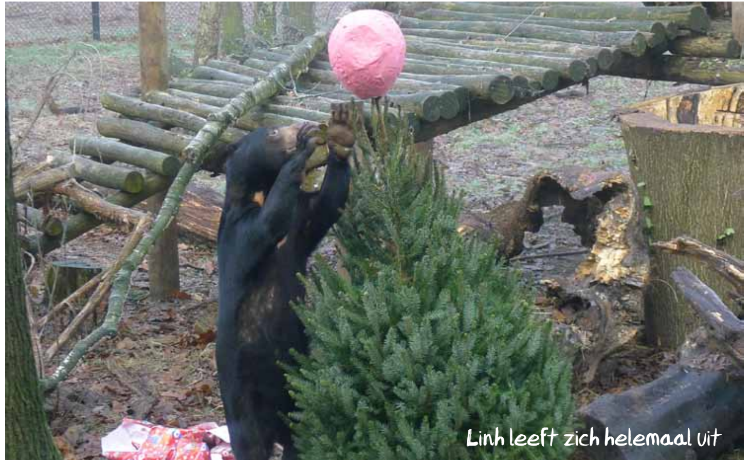
Linh leeft zich helemaal uit

Cindy maakte ieder pakje voorzichtig open en genoot van al het lekkere eten terwijl Linh wat minder geduld had en al snel alle pakjes open had gescheurd. Een heerlijke meloen werd zelfs genegeerd hoewel een lekkere peer wel snel werd opgegeten. Linh was ook nieuwsgierig geworden naar de boom van Cindy en had in korte tijd ook daar alles opengescheurd. De lange tong van Maleise beren gebruiken ze in het wild om honing uit een nest te likken. Die tong kwam nu goed van pas om de meelwormen zorgvuldig uit de boom te halen. En als toetje nam Linh de kokosnoot behendig in haar voorpoot mee naar het platform. Wat een verbetering van hun leven!