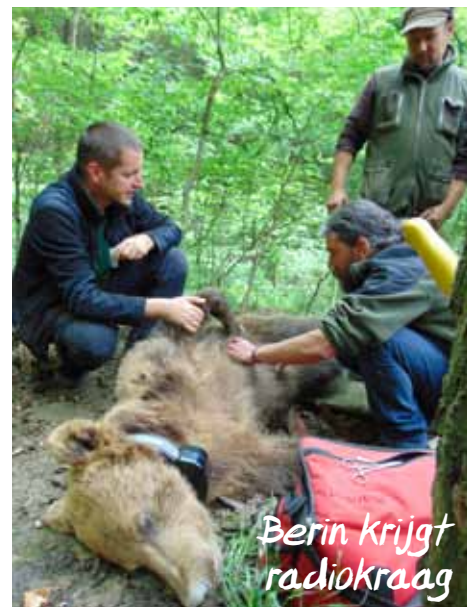
Berin krijgt radiokraag

Een belangrijk onderdeel van dit project is het zenderen van beren. Beren worden gevangen in een kooi waarin iets onweerstaanbaars