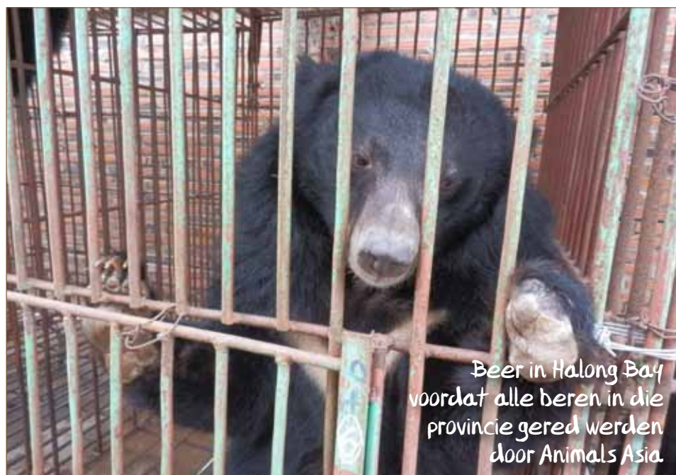
Beer in Halong Bay voordat alle beren in die provincie gered werden door Animals Asia.

tot gevolg, ze zijn vaak erg dun of juist heel erg dik door een incorrect dieet, ze vertonen gestoord gedrag doordat er niets natuurlijk is aan het houden van een beer in een klein, leeg metalen hok. Deze vreselijk wrede industrie is onnodig aangezien er alternatieven beschikbaar zijn die onder andere leverziekten net zo effectief behandelen. In 2000 werd een opvangcentrum in Chengdu, China opgezet en in 2006 ging de bouw van het centrum in Tam Dao, Vietnam van start. Ik heb daar de eerste drie weesjes met de fles opgevoed, nadat hun moeder was gedood en de jongen op weg waren naar een beerboerderij. Door de jaren heen hebben wij een wereldklasse opvangcentrum gebouwd waar in 2016 bijna 150 Aziatische zwarte beren (kraagberen) en Maleise beren een onderkomen hadden. De zeer ervaren berenverzorgers en dierenartsen werken hard om de lichamelijke en mentale problemen te verhelpen zodat de beren hun wrede verleden achter zich kunnen laten.