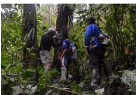
Het onderzoeksteam verzamelt gegevens door middel van cameravallen, het in kaart brengen van krabsporen, het onderzoeken van uitwerpselen en het verzamelen van haarmonsters.

Beren communiceren met elkaar door geuren en sporen achter te laten op bomen. Er is niet veel kennis over markeergedrag en specifieke kenmerken van markeerplekken (boomsoort, kenmerken van het terrein, relatie tot beer-mens conflicten) van beren in het algemeen en brilberen in het bijzonder. Ook is er weinig bekend over de status van de lokale beerpopulaties in de studiegebieden. Betrouwbare gegevens zijn noodzakelijk zodat er een managementplan voor de bescherming van de beren kan worden gemaakt. Op de kaart van Ecuador zijn de twee onderzoeksgebieden gemarkeerd.