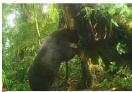
Deze database is belangrijk voor lokale en internationale onderzoeksdoelstellingen. Hoe meer er over de brilbeer en zijn gedrag bekend is, des te beter hij beschermd kan worden.