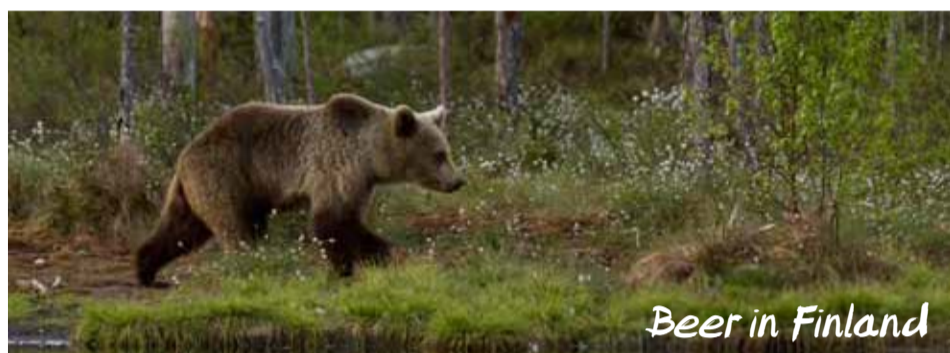
Beer in Finland

Iedereen weet dat 4 oktober Wereldierendag is. Een speciale dag, die volgens Wikipedia het volgende doel heeft: "(...) een dag die wereldwijd op de agenda staat als een moment waarop extra aandacht wordt besteed aan de dieren. (...) Met het vieren van deze dag wil men mensen laten weten dat dieren rechten hebben en dat zij beschermd moeten worden." Het idee voor een speciale dag voor de dieren ontstond begin vorige eeuw. In 1929 werd tijdens een congres van verenigingen voor de bescherming van dieren in Wenen besloten 4 oktober aan te wijzen als de dag waarop wereldierendag plaats ging vinden. Binnen de Katholieke kerk is 4 oktober de feestdag van de heilige Franciscus van Assisi, de stichter van de orde der Franciscanen. Hij bekommerde zich niet alleen om de armen en zieken, maar ook om dieren en planten.