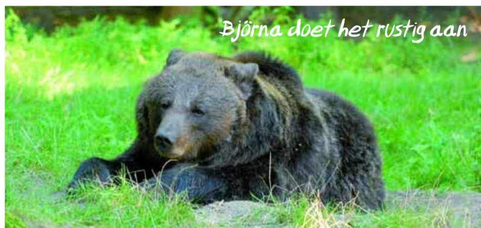
Björna doet het rustig aan