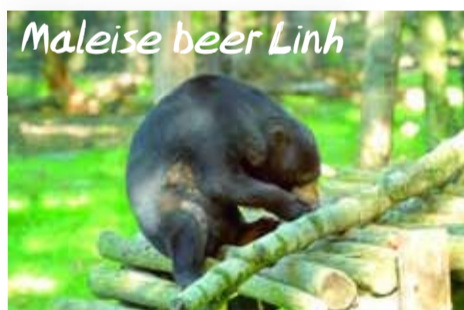
Maleise beer Linh

Ik ben onder de indruk, hoe de mensen van Het Berenbos voor deze, door mensen niet echt goed behandelde, beren zorgen. Ze zien