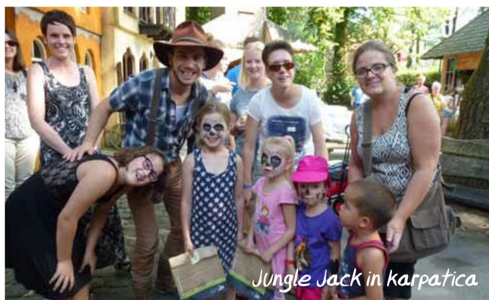
Jungle Jack in Karpatica