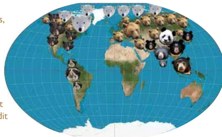
Verspreiding van de beersoorten

De IUCN Rode Lijst van bedreigde soorten wordt wereldwijd gebruikt door wetenschappers, docenten, natuurbeschermers, beleidsmakers en andere geïnteresseerden. De lijst wordt samengesteld door experts en bevat een schat aan informatie over dier- en plantsoorten over de gehele wereld. Van de biologie van een soort tot verspreiding, habitat, bedreigingen en benodigde beschermingsmaatregelen. Landen gebruiken de Rode Lijst om hun beschermingsmaatregelen te evalueren en bij te stellen. De lijst bevat niet alleen bedreigde soorten. Alle soorten die ooit zijn onderzocht zijn er in opgenomen. Als een soort niet op de lijst staat, wil dat niet per se zeggen dat deze niet bedreigd is. De kans is groot dat de soort simpelweg nog niet is onderzocht! Er staan nu zo'n 79.000 soorten op de lijst. Streven is om dit aantal te vergroten tot 160.000 in 2020.