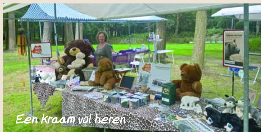
Een kraam vol beren

Het was gezellig en veel mensen hebben weer geleerd over de beren!