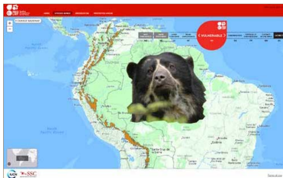
Verspreidingskaart van de brilbeer