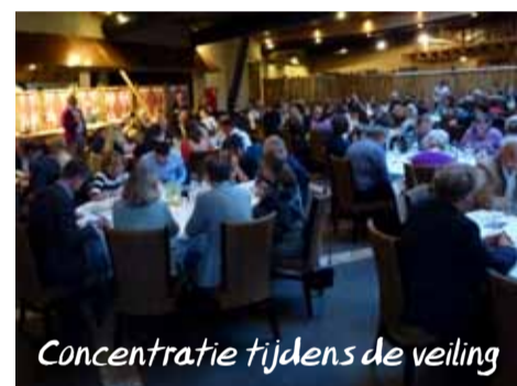
Concentratie tijdens de veiling

De Dag van de Natuur toont elk jaar weer de kracht van samenwerken; de leden van GlobeGuards bundelen op deze manier hun krachten om gezamenlijk geld in te zamelen voor hun natuurbeschermingsprojecten. Deze projecten zijn klein, overzichtelijk en worden uitgevoerd op uiterst efficiënte wijze. Wilt u