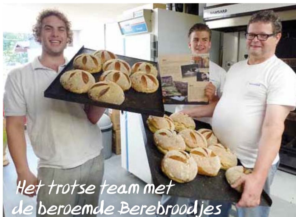
Het trotse team met de beroemde Berebroodjes