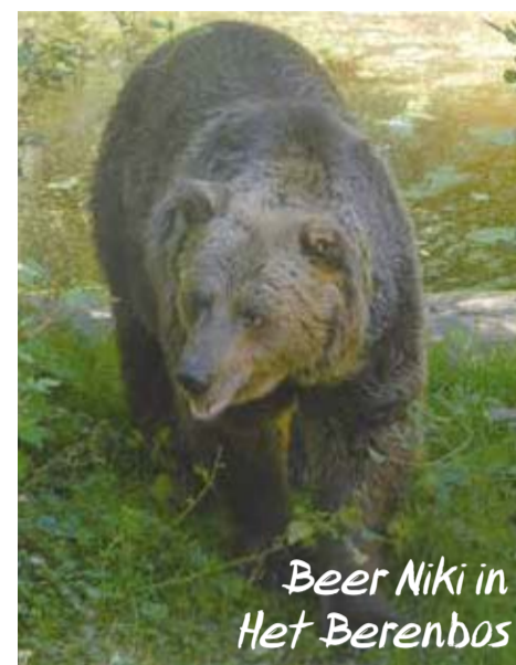
Beer Niki in Het Berenbos

Als ik die vraag aan de natuur zou stellen en deze een stem zou hebben: Gelukkig zijn er (jonge) mensen die geïnteresseerd zijn in de natuur, in dieren en andere levende organismen; geïnteresseerd in