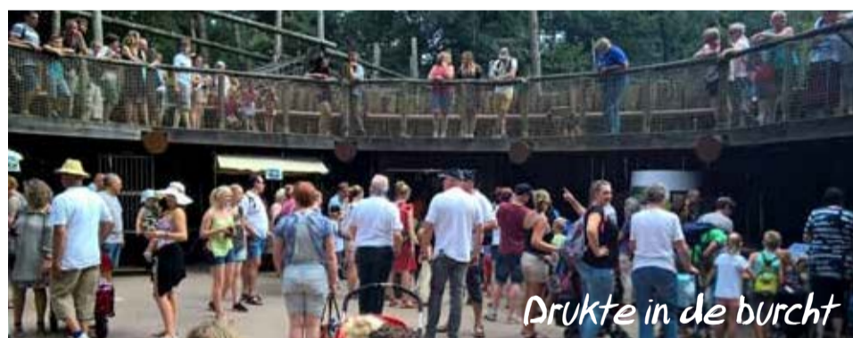
Drukke in de burcht